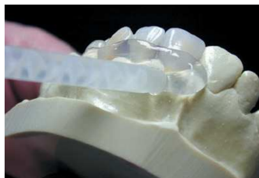
Высокая текучесть ELITE TRANSPARENT при нанесении