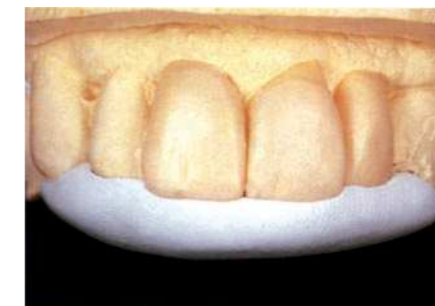
Матрицы для изготовления временных протезов