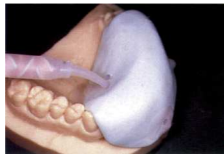
Матрица из ZETALABOR с каналами для инъецирования