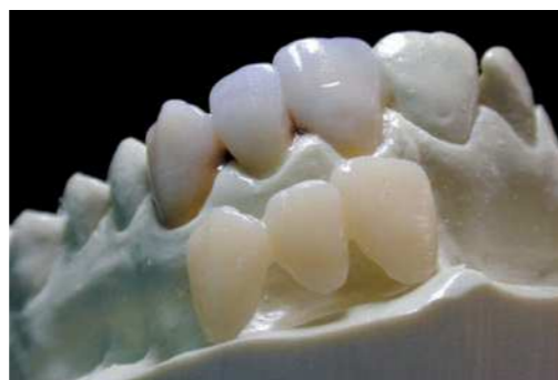
Конечный результат: компактная поверхность конечного продукта из композита в сравнении с традиционными работами из светотверждаемых пластмасс

lab silicones solutions Вы в хороших руках.