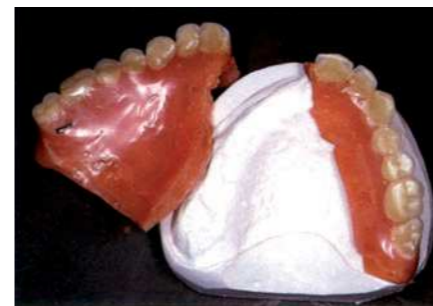
Починка съёмных протезов