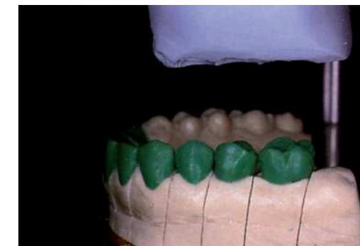
Работа с керамикой на вертикуляторе