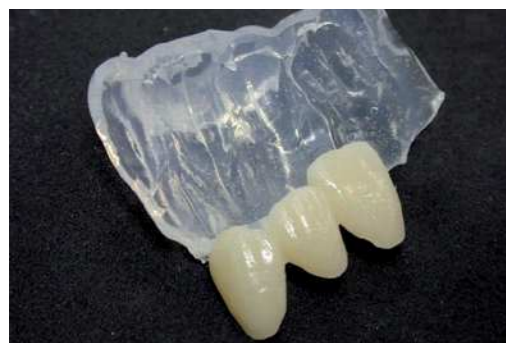
Идеальная твёрдость для применения композита без создания деформации