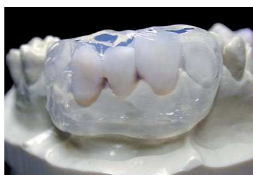
Высокая степень прозрачности