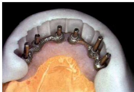
Контрольная матрица для проектирования металлической структуры