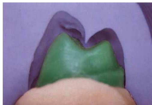
Контрольная матрица для создания металлической структуры